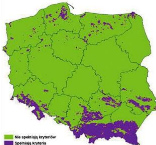
Ryc. 1. Wykaz obszarów zagrożonych erozją wodną